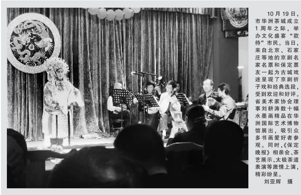
10月19日，市华洲茶城成立1周年之际，举办文化盛宴“款待”市民。当日，来自北京、石家庄等地的京剧名家名票和保定票友一起为古城戏迷呈现了京剧折子戏和经典选段，受到欢迎和好评。省美术家协会理事刘耕涛数十幅水墨画精品在华北国际艺术博物馆展出，吸引了众多书画爱好者参观。同时，《保定晚报》相亲会、茶艺展示、太极茶道表演等激情上演，精彩纷呈。

非物质文化遗产是中华文化传承、华夏文脉延续的重要载体。在经济高速发展，各种文化现象此起彼伏的今天，保护非遗显得尤其重要。 中国文化的根在农村，大多数非遗项目在农村，各式各样的民俗，如传统节日、婚俗、民间传说、戏剧、美术、曲艺，大到石雕小到泥人儿都在农村。但是，如今农村中的青年人纷纷外出打工、做生意赚钱，后继乏人是各非遗项目普遍存在的问题。我市的非遗项目品种杂、分布广、受众小，保护任务十分艰巨。近年来，虽然我市在保护非遗方面做了大量工作，但现实中，人们对非遗保护的重要性认识还远远不够。首先是宣传不够，非遗项目有哪些？多数人含混不清，更加缺乏保护意识。再有就是投入不够，缺乏资金成为困扰非遗推广传承的首要问题。 非遗保护决不是让子孙后代有戏看、有古乐听、有易水砚可以玩玩这么简单。当一些传统技艺只有在博物馆才能看到，一些古乐只有在历史文献中才能知晓的时候，不能不说是一个民族的遗憾。正如中国文联副主席冯骥才所说：“假如再过十年、二十年，我们的孩子根本就不知道中国文化是什么样的了，这对一个国家来说，是一个很严重的问题。”因此，我们在非遗保护上绝不能出台个措施、喊喊口号了事，不能以简单的投入产出比来算账，必须真金白银地加大投入，加强保护，让中华文化精髓代代相传。