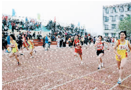
定州市日前举办迎奥运中学生田径运动会,来自该市25个乡镇办、8所高中及5所民办学校的38支代表队共591名运动员以及百余名裁判员参加运动会。

菲斯大学队比赛3场。6月12日、14日和16日,中国男篮将在烟台、上海宝山、济源与克罗地亚队打3场。6月22日、24日,中国男篮在东莞、深圳与立陶宛队战两场。7月4日、6日,中国男篮将在无锡、宁波与澳大利亚全明星队赛两场。这10场热身赛将是对中国男篮“无姚”战术的一次检验。