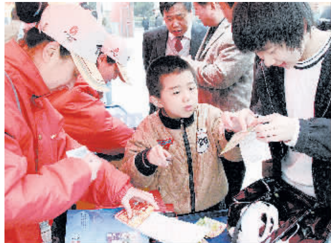
4月12日,奥运主题即开型体育彩票首发联销启动仪式在我市体育场广场西侧隆重举行,吸引了众多市民热情参与。当天,奥运主题即开型体育彩票在我省11个地市同时上市发售。此次推出奥运主题系列体育彩票分为竞猜型彩票和即开型彩票两大类。 记者以工 李潇摄影报道